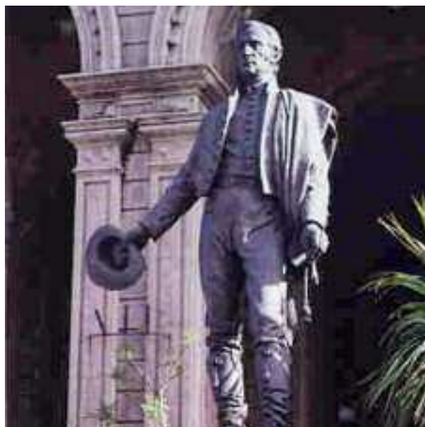
Monumento Artigas (1949)

José Luis Zorrilla de San Martín (1891-1975) Estación Central de AFE